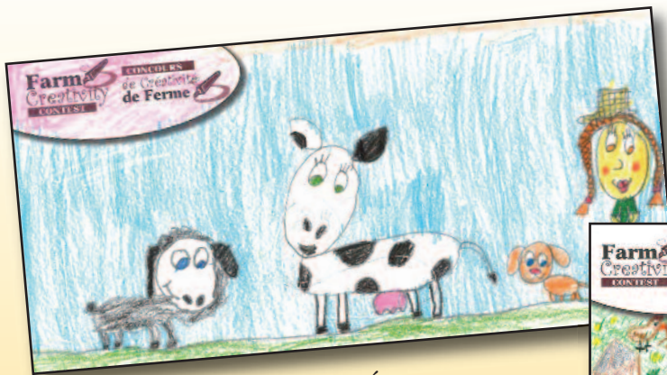
de la maternelle à la 2 e année