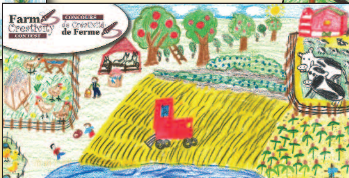
de la 3 e à 5 e